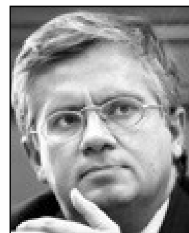
Eduardo Cabrita Secretário de Estado Adjunto e da Administração Local Sessão de Abertura

A comunicação autárquica é decisiva para a qualidade, eficácia e pluralidade da democracia local. O esforço de participação e envolvimento das populações locais, e a afirmação da capacidade transformadora da Administração Local, dependem da divulgação estruturada, permanente e actualizada dos projectos autárquicos.